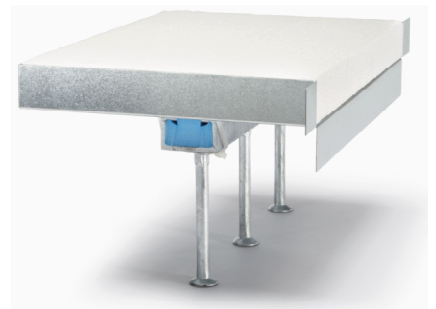
Caja JORDAHL® con relleno de espuma y rail de anclaje