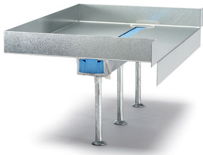
Caja JORDAHL® con rail de anclaje